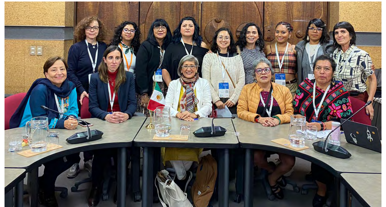
Delegación de México