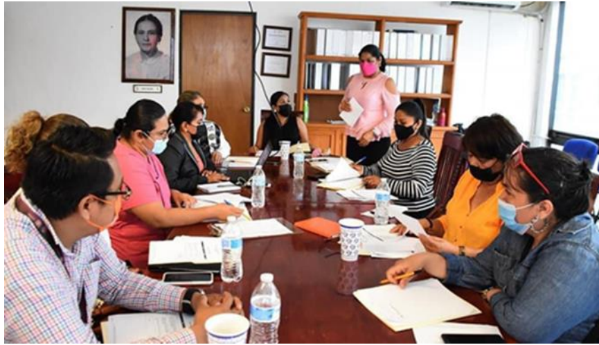
PRESENTACIÓN DE LAS FUNCIONES DEL COMITÉ DE VIGILANCIA A CARGO DE LA RESPONSABLE DE PARTICIPACIÓN CIUDADANA