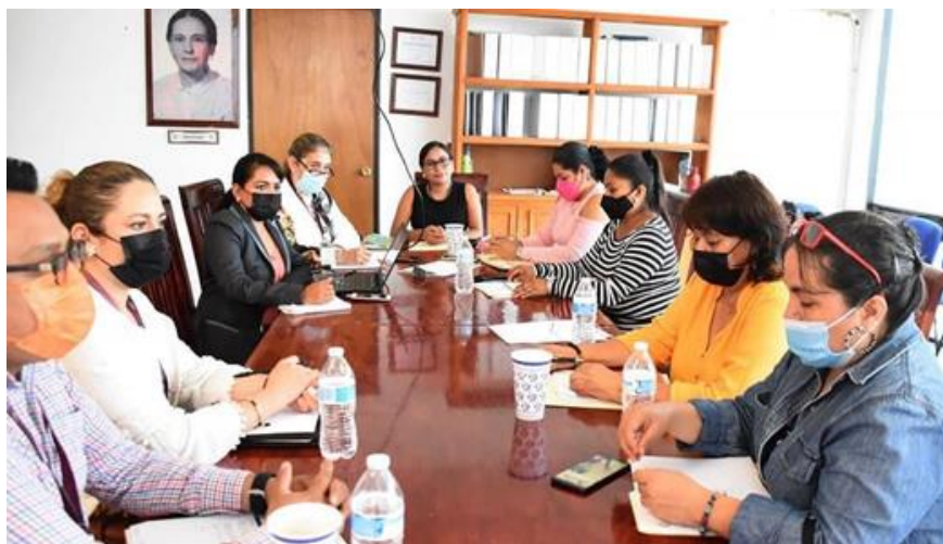
BIENVENIDA A ASISTENTES