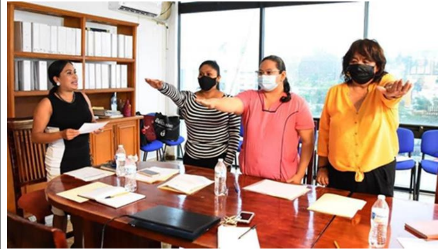
TOMA DE PROTESTA POR INTEGRANTES DEL COMITÉ DE VIGILANCIA

*La IMEF es la responsable del tratamiento de los datos personales proporcionados por la población beneficiada, así como cumplir a cabalidad lo dispuesto en la Ley Federal de Protección de Datos Personales en Posesión de los Particulares. Usted podrá consultar el aviso de privacidad integral en: www.guerrero.gob.mx/dependencias/secretaria-de-la-mujer-fobam 2022