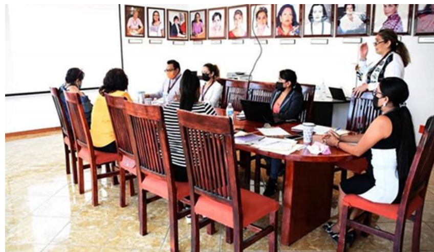
PRESENTACIÓN DEL PROYECTO Y METAS COMPROMETIDAS